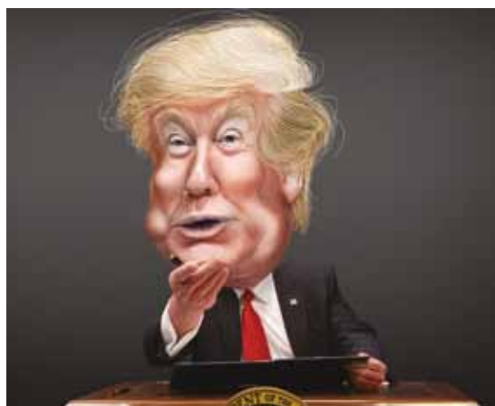
« La vérité n'est pas vraie ! », aboie l'entourage de Donald Trump. Désormais, le fait ne constitue plus ce plus petit commun dénominateur sans lequel il n'y a pas d'opinion possible.