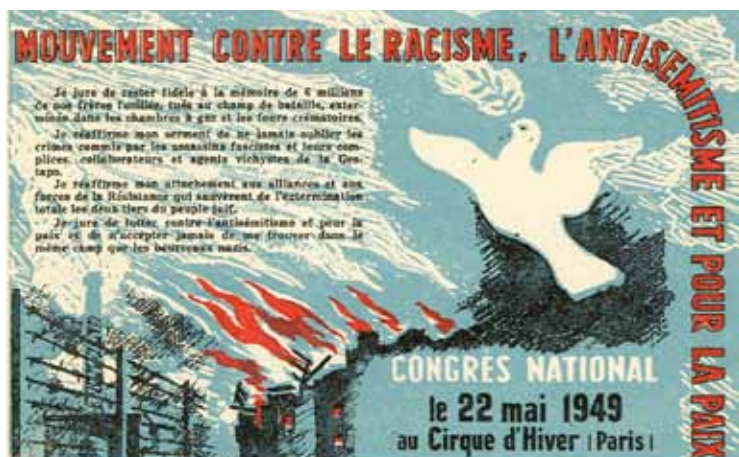
Antiracisme universaliste 1. Le 22 mai 1949 à Paris, le congrès fondateur du Mouvement contre le racisme, l'antisémitisme et pour la paix.

fait polémique au carnaval d'Alost, après une instruction approfondie du dossier, à charge et à décharge, nous avons conclu qu'il n'y avait pas d'intention de pousser autrui à adopter un comportement antisémite dans le chef des carnavalistes incriminés, même si le char lui-même véhiculait indéniablement plusieurs stéréotypes antisémites et renvoyait à certaines représentations du régime nazi. Le second type de sanction légale de l'antisémitisme vise les actes de haine (p. ex., les dégradations visant des bâtiments juifs, le harcèlement de personnes parce qu'elles sont juives, les menaces... le cas récent le plus grave étant l'attentat au musée juif). Troisièmement, l'antisémitisme est également réprimé par la loi concernant la négation du génocide des Juifs par les nazis.