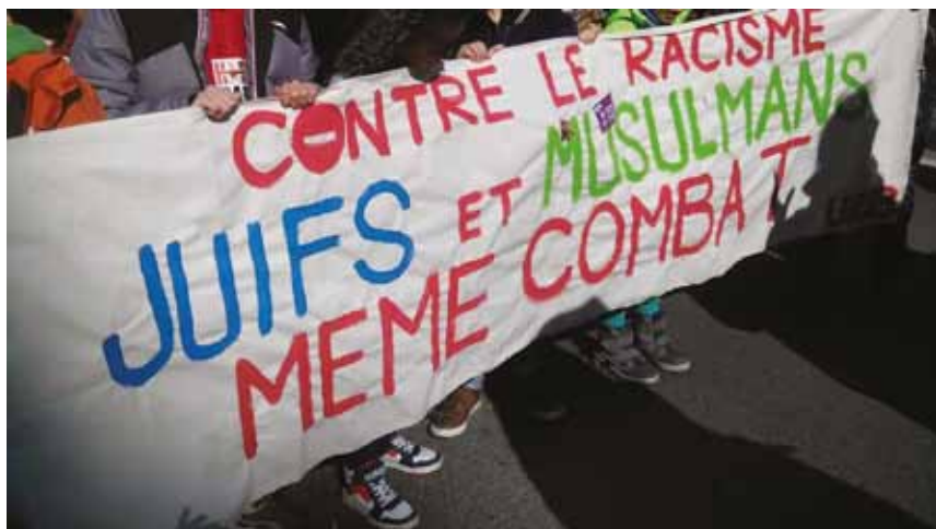
Antiracisme universaliste 2. Le 24 mars 2018 à Bruxelles, les jeunes de l'Union des Progressistes Juifs de Belgique à la manif contre le racisme.

antisémites sont définies par les lois belges et c'est au premier chef au niveau de leur application qu'il faut faire porter notre effort. Il y a d'ailleurs dans les lois belges des outils pour combattre l'antisémitisme qui vont au-delà de ce qui se trouve contenu dans la définition de l'IHRA. Par exemple, l'IHRA n'évoque que « la négation » du génocide des Juifs par les nazis, tandis que la loi belge condamne également « l'approbation » et « la justification » du génocide, ce qui va également au-delà. La définition de l'IHRA ne convient donc pas nécessairement pour déterminer l'ensemble des comportements antisémites légalement prohibés en Belgique. Cette définition peut toutefois être utilisée pour compter et quantifier de façon plus large des actes antisémites. Nous nous sommes donc posé la question : si l'on applique la définition de l'IHRA aux dossiers que nous avons traités en 2018, qu'est-ce que cela changerait au regard de leur qualification en tant